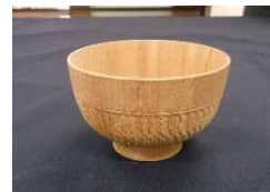
けやし筋入り汁椀(1900円)

10回で一工程として作品を仕上げますので、 第1回目の時に作る作品を上記より3～4品選んでもらい実施します。