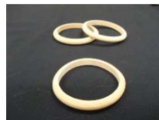
ブレスレット(1つ100円)