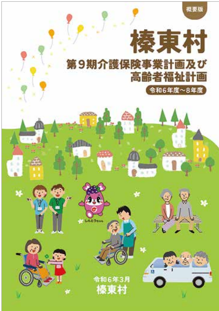
4月下旬に每户配布予定