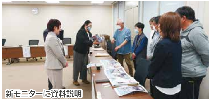
新モニターに資料説明