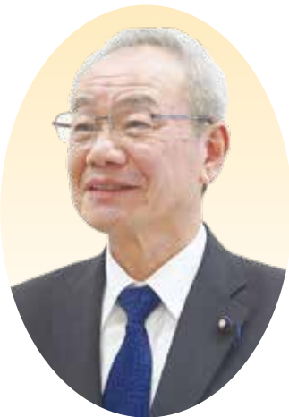
みつ また みのる 三 実 議 員