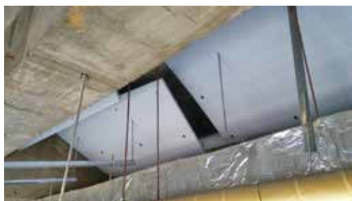
断熱材の剥離が見つかった天井