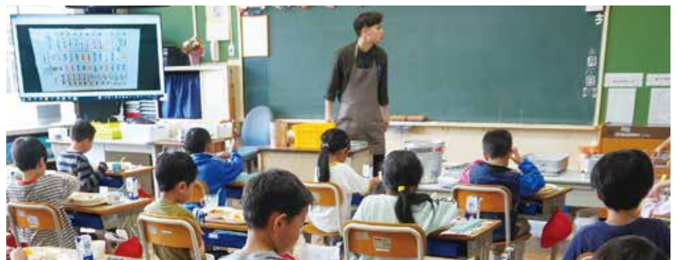
「もっとおいしく安全な学校給食」の推進に期待