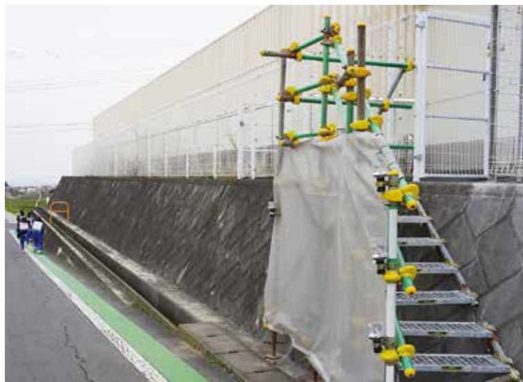
う回路の仮設階段