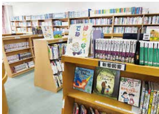
デジタル化により借りやすく (南部コミセン図書室)