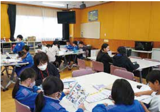
南部第四学童保育所

東京高等裁判所に控訴中の分限処分取消控訴事件(二審)について、村 として控訴を取り下げたことから、一審判決が確定となりました。 確定を受けて、実際に支給した給与等と分限処分がなければ支給されてい たはずの給与等の差額に対する遅延損害金を支払ったと報告を受けました。