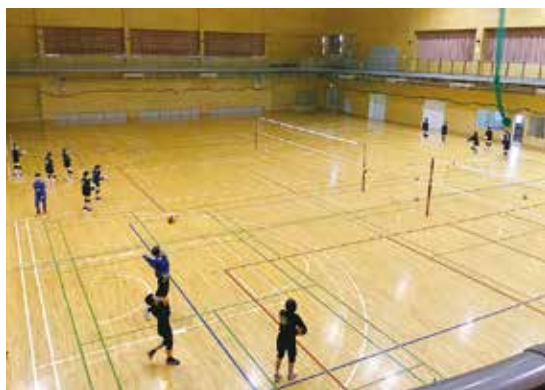
部活動に励む中学生

答 教育委員会事 務局長 部活 動が行き過ぎた指導 に陥らないために、 国や県の方針も踏ま え、村でも部活動の ガイドラインを策定 しています。