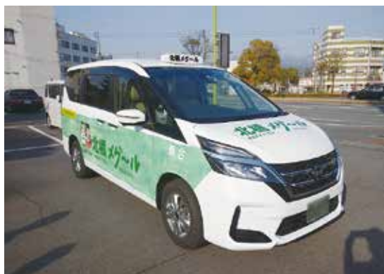
必要とされるデマンドバス

いうことです。想像力が身につけば他人を思いやる気持ちも育まれ、「コミュニケーション力も上がる」といいます。このことを考慮し、村民の立場に立てば、少々財政負担があっても前向きにこれらの設備を整えることが必要だと思います。さらに、最近注目されている非認知能力が育まれ、人として豊かな発想が生まれ、さまざまな研究を行い、