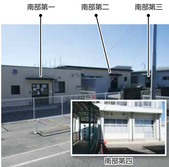
学童保育所増設で待機児童解消へ

住民生活課長 保護者等から名称がわかりづらいとの意見があったためです。南側から、第一、第二、第三と変更します。