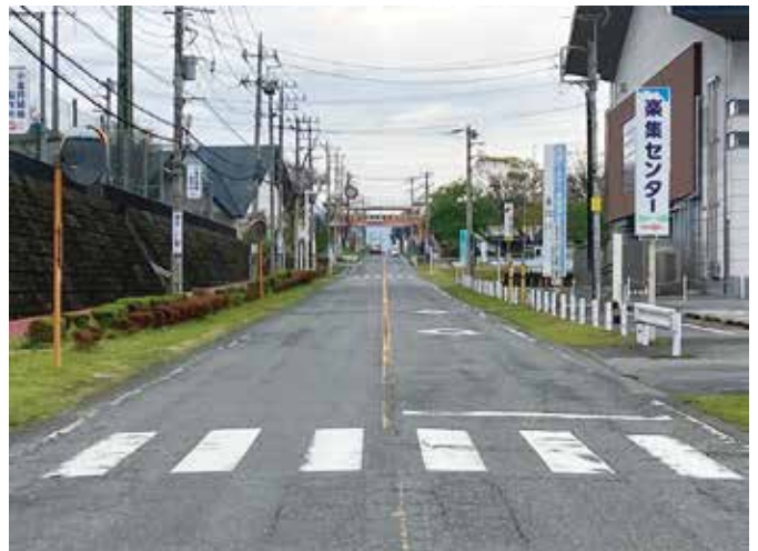
舗装調査が行われる上野幹線