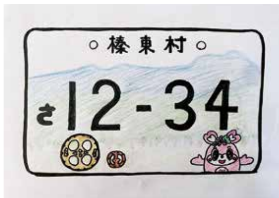
50ccバイクのご当地ナンバー案 (イメージ)

保健センター 考えています。内に設置している子育て世代包括支援センターの業務と、当課の児童福祉に関する業務を一体的に行う機関であると認識しています。現状では設置計画はありません。