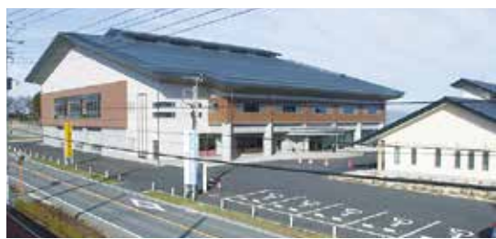
しんとうスポーツアリーナ

これまで熱中症予防の観点から利用してきたしんとうスポーツアリーナの冷暖房設備が、使用者の申し出により利用できるようになります。利用時に発生する費用について、使用者に自分の負担を求めるための改正です。