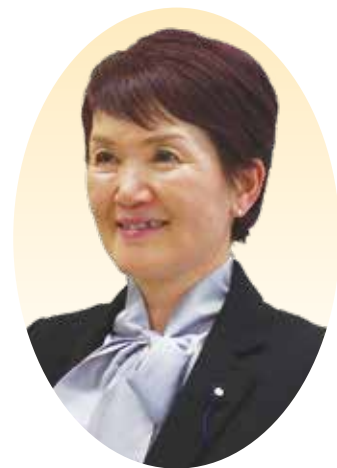
はたのさわこ 波多野佐和子 議員