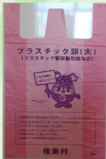
プラスチック類専用指定袋