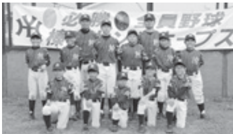
県大会出場：榛東ヤングホープス（北小野球）