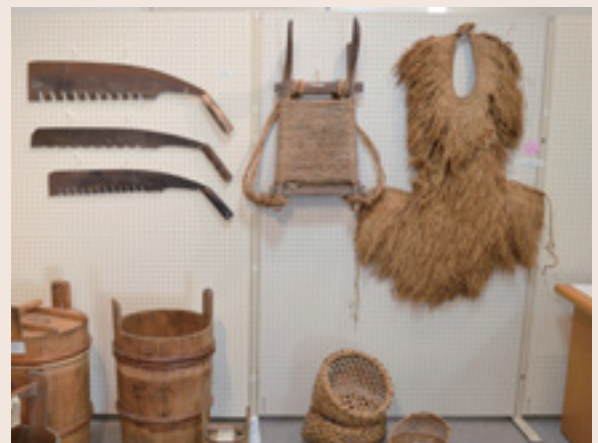
(耳飾り館で開催中の「むかしの暮らし展」)