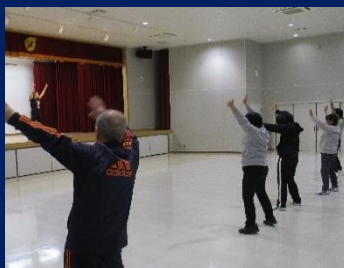
去年の教室の様子