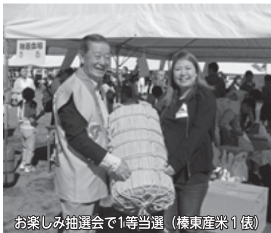
お楽しみ抽選会で1等当選（榛東産米1俵）