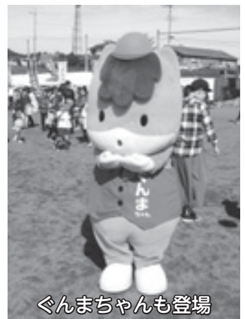
ぐんまちゃんも登場