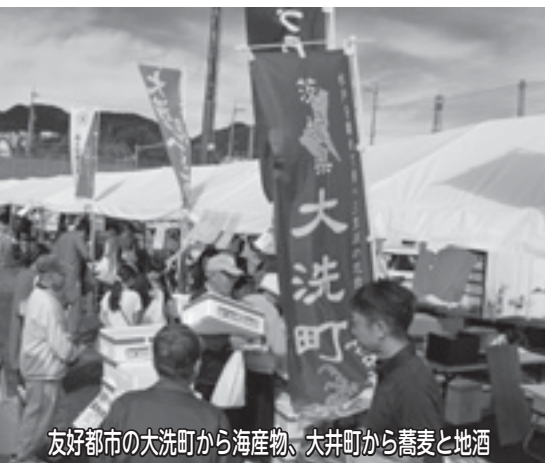
友好都市の大洗町から海産物、大井町から蕎麦と地酒