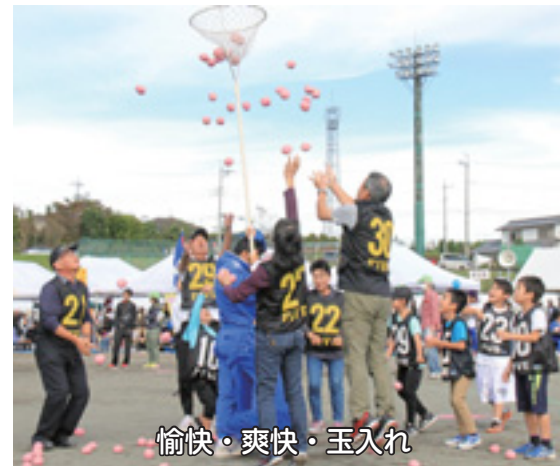
愉快・爽快・玉入れ