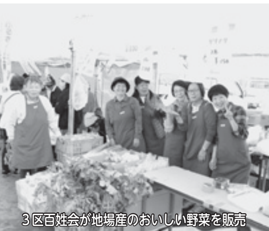
3区百姓会が地場産のおいしい野菜を販売