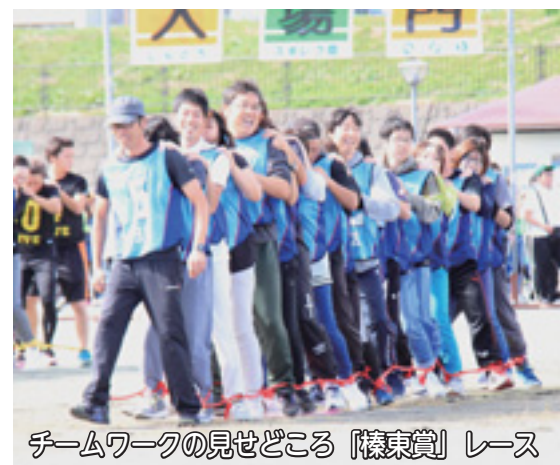
チームワークの見せどころ「榛東賞」レース