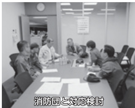
消防団と対応検討