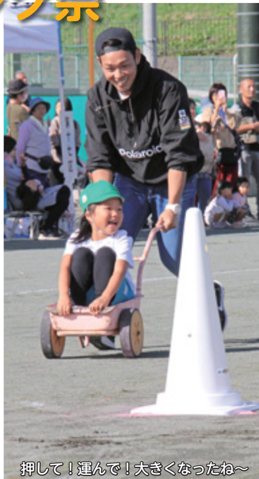
押して！運んで！大きくなったね～