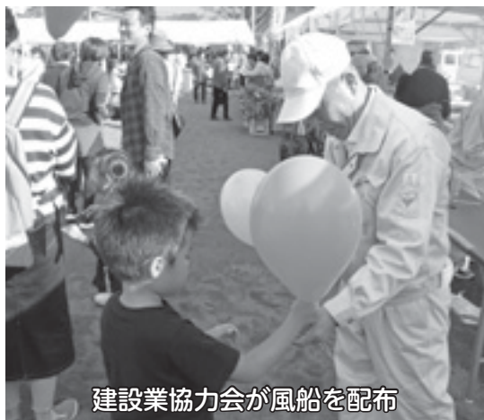
建設業協会が風船を配布