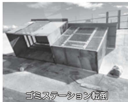
ゴミステーション転倒