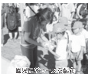
園児にジュースを配布