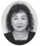
監修 河崎 和代