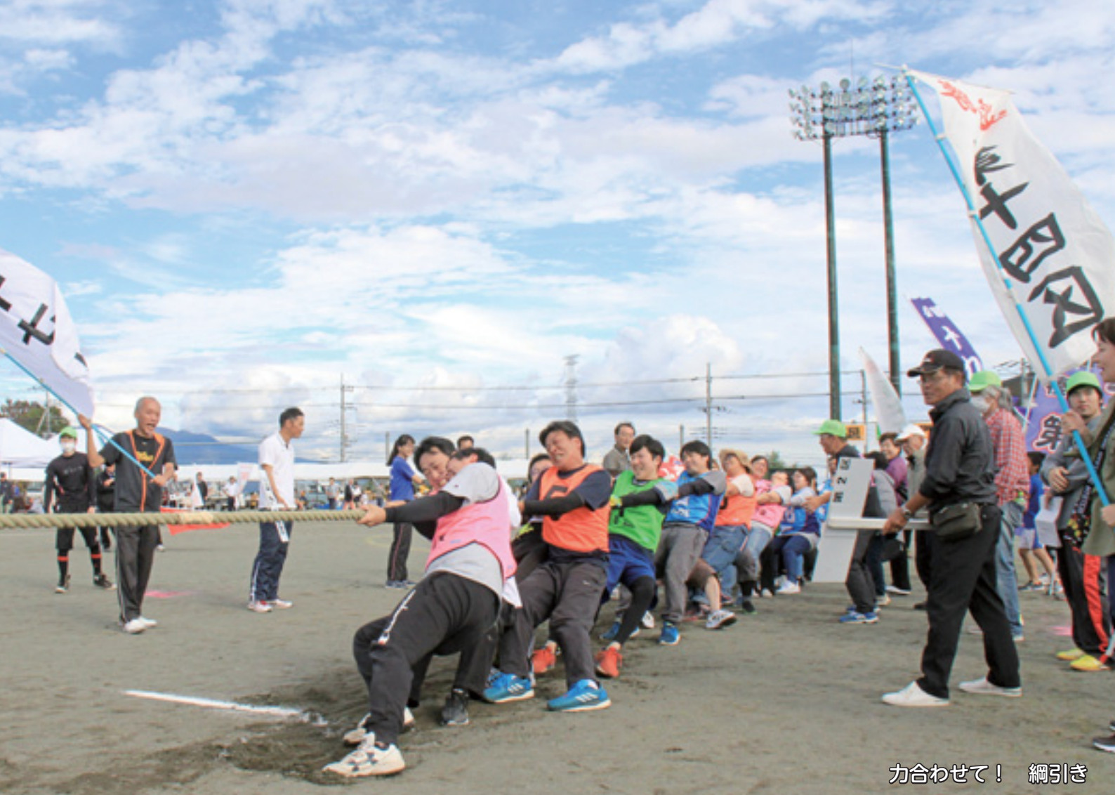
力合わせて！ 綱引き