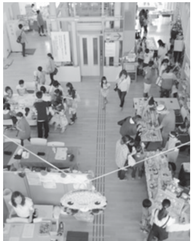
(写真は去年の様子)