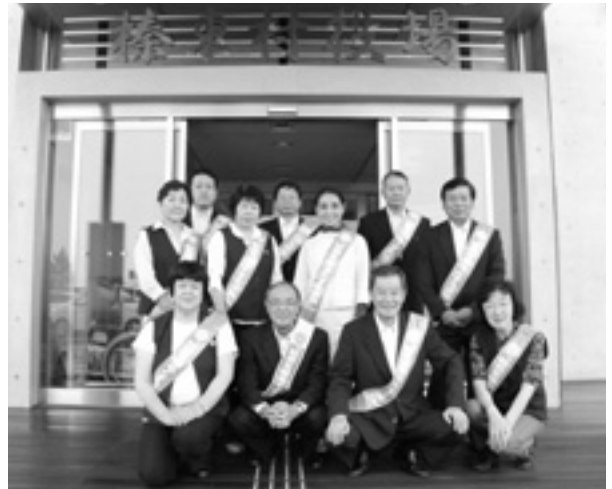
村長・教育長と村内への広報活動に出発する保護司および更生保護女性会役員の皆さん