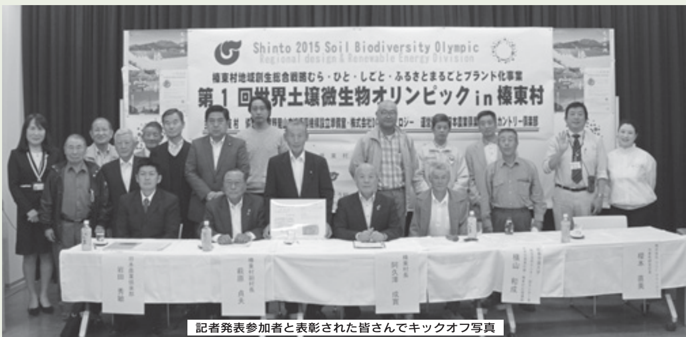
記者発表参加者と表彰された皆さんでキックオフ写真