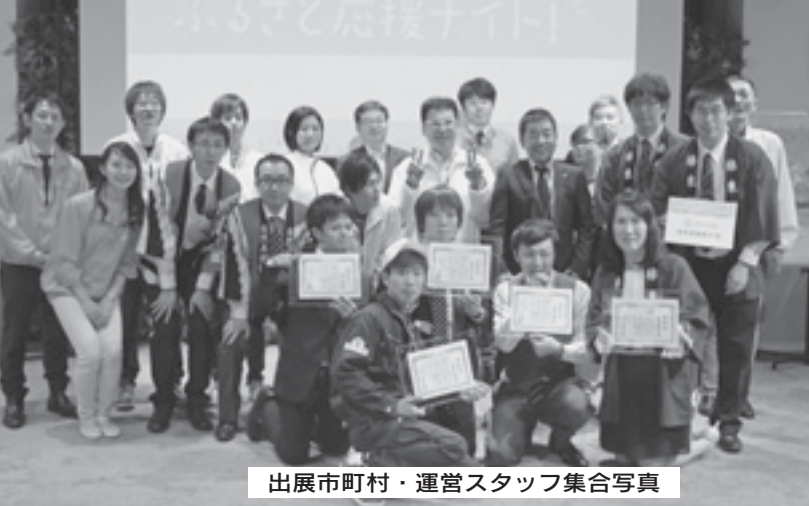
出展市町村・運営スタッフ集合写真

地域の魅力発信・ふるさと納税体感イベント企画であり、全国上位の6市町村が出展し、各市町村のブースでの地域の説明 や特産品の試食提供によって、ヤフー株式会社の社員約100人を対象に各市町村の魅力の発信をしました。村では地域創生ふるさと応援事業で特に人気のある上州牛のステーキと、果汁100%リンゴジュースを出品し、ステーキは長蛇の列となり早い段階で試食の予定数が終了するほどの人気があり、リンゴジュースも国内随一の甘ささわやかさであると高い評価を得ました。