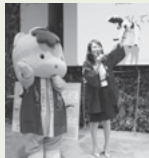
▲榛東村とぐんまちゃんとのコラボで榛東村のお国自慢

○ヤフー株式会社と村は「災害に係る情報発信等に関する協定」を平成27年5月1日に締結しました。大規模な災害時に避難情報等をヤフー株式会社に提供しホームページに掲載されます。