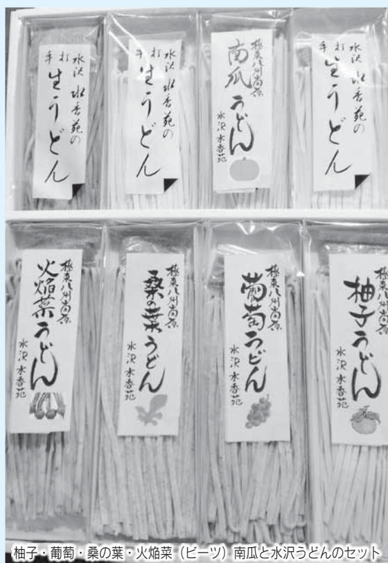
柚子・葡萄・桑の葉・火焰菜(ピーズ) 南瓜と水沢うどんのセット

現行の自動車と比べ排出ガスがゼロで石油の代替エネルギーを利用できる電気自動車等の次