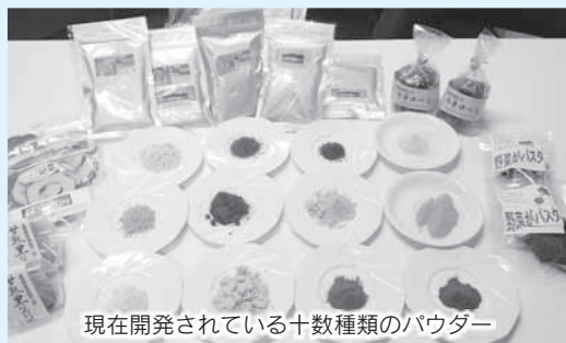
現在開発されている十数種類のパウダー