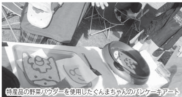
特産品の野菜パウダーを使用したぐんまちゃんのパンケーキアート