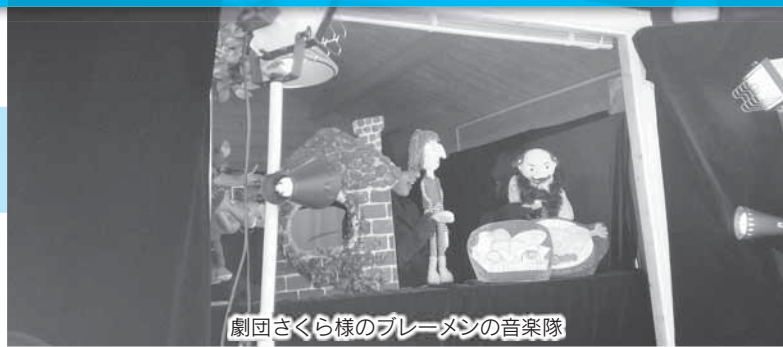
劇団さくら様のブラスの音楽隊

10月26日から28日の3日間、自然エネルギーの普及推進と、地域の特産品の紹介等を目的とした群馬県民の日サンフェスタ in ソフトバンク榛東ソーラーパークをSBエナジー株式会社他にご協賛いただき、開催いたしました。