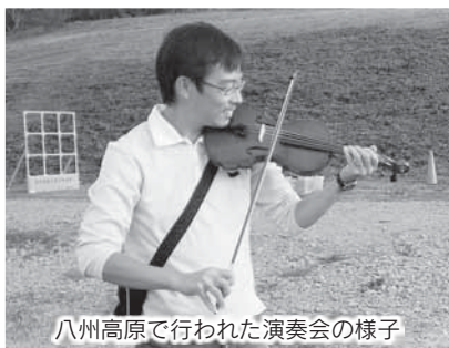
八州高原で行われた演奏会の様子

10月26日から28日の3日間、自然エネルギーの普及推進と、地域の特産品の紹介等を目的とした群馬県民の日サンフェスタ in ソフトバンク榛東ソーラーパークをSBエナジー株式会社他にご協賛いただき、開催いたしました。