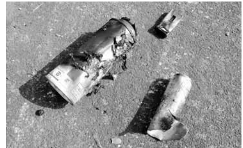
▲火災の原因と考えられる「スプレー缶」、「カセットボンベ」と「使い捨てライター」