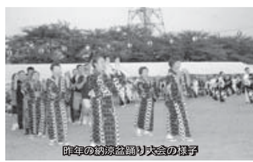
昨年の納涼盆踊り大会の様子

■期日：8月6日(水)(予備日8月7日(木)) ■時間：午後6時～9時(駐屯地一般開放：午後4時～8時30分) ■場所：相馬原駐屯地グラウンド ■催し物：模擬売店、太鼓演奏、小学生以下を対象としたミニゲーム、打ち上げ花火大会、盆踊り大会など ▼お問い合わせは、相馬原駐屯地広報班(☎54-2011)へ