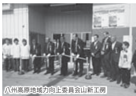
八州高原地域力向上委員会山新工房

次に、八州高原地域力向上委員会山新工房では低温減圧平衡発酵乾燥機の導入を受け、新たな雇用も生まれ、新鮮な地元野菜等を乾燥果実、乾燥野菜、粉末化しパン工房でそれらをふんだんに練り込んだパンやラスクを製造。さらにその余剰をドライフルーツ・ドライベジタブルなどの新たな特産品に成長させ