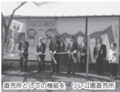
直売所としての機能を リンゴ園直売所

温泉からの交流人口のみならず、関東近県からの集客力をもち、新たな商品開発に余念が無く、焼きドーナツなどのスイーツでも多くのリピーターを確保されていました。その中で、一昨年11月に開発した手作りラスクで人気を得て、ラスクの生地となるフランスパンの工場などの新設を夢見ておられ、本村の新たな特産品づくりになると村で見極めたものです。