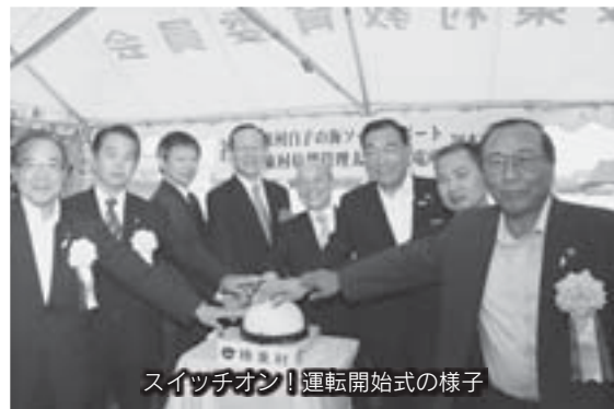
スイッチオン！運転開始式の様子

この様子はTBSテレビなどで大きく取り上げられるなど、榛東村が行う復興支援策であり、榛東村自然エネルギーの推進に関する条例で規定する原発の代替エネルギーの普及推進に寄与する発電所として誕生しました。