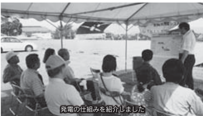
発電の仕組みを紹介しました

詳細のわかるパンフレットは、毎戸配布をする予定となっております。今しばらくお待ちください。