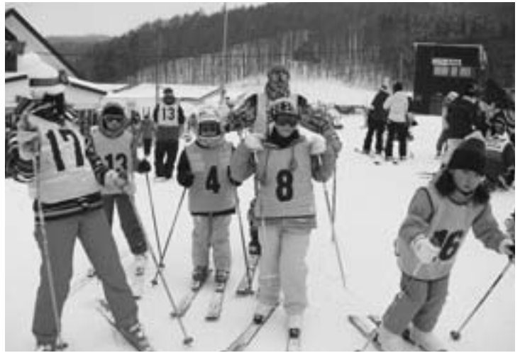
家族でスキーを楽しむ