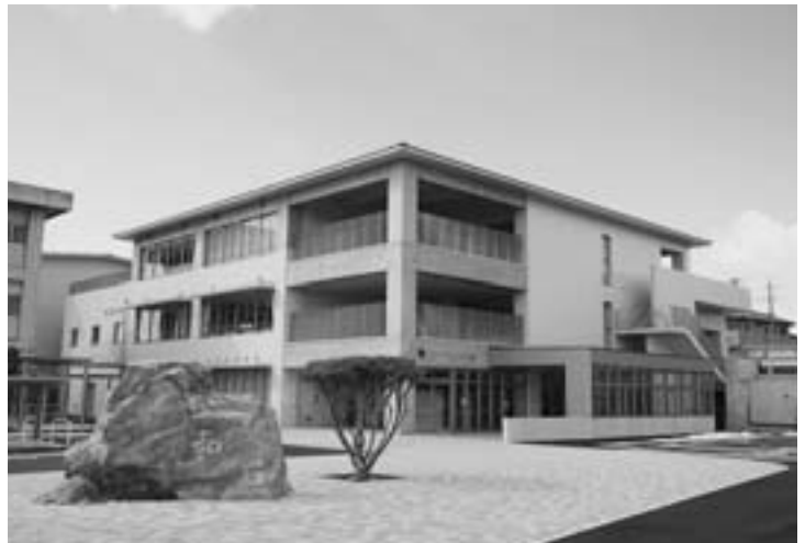
中学校整備事業が全て完了

総勢59名が参加した教室は、午前中に同協会スキー専門部の部員が講師となり、適切な指導のもと基本的なスキー技術を学びました。午後のフリー滑走では、ファミリーで思い思いに滑り、スキーを楽しみました。