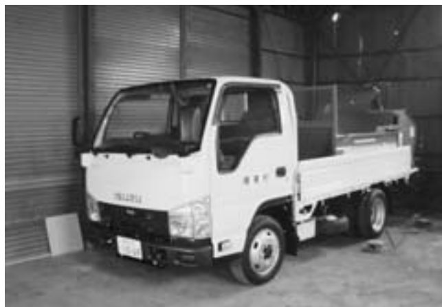
堆肥散布車架台2tトラック

榛東村農業機械利用組合では、堆肥散布の請負を12月1日から行っています。利用料金等については右の表をご参照ください。