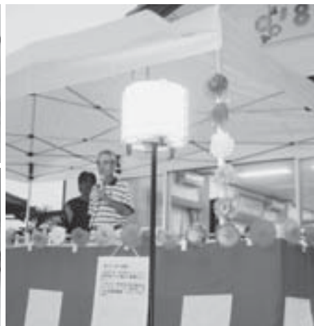
(財)自治総合センターから