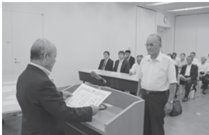
平成24年度総合表彰式