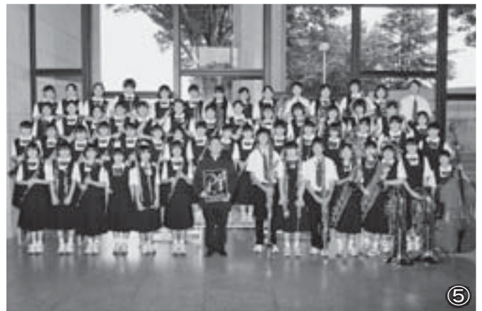
体操・柔道・水泳・剣道・吹奏楽