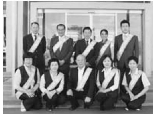
村長と村内への広報活動に出発する保護司および更生保護女性会役員の皆さん