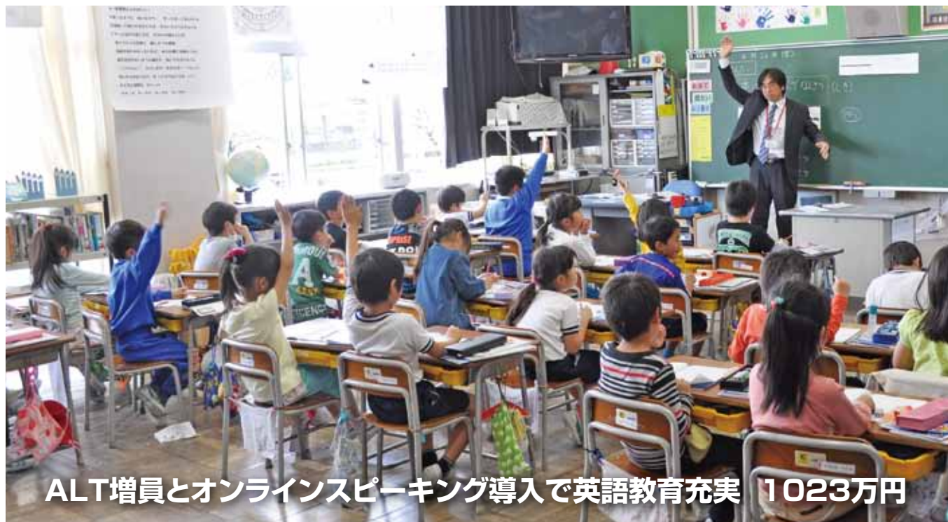
ALT増員とオンラインスピーキング導入で英語教育充実 1023万円