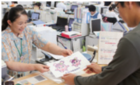
ようこそ様東村へ

平成28年1月に第一弾が作成され、4月より新たに更新された案内パンフレットを、転入者に住民生活課の窓口で配布しています。