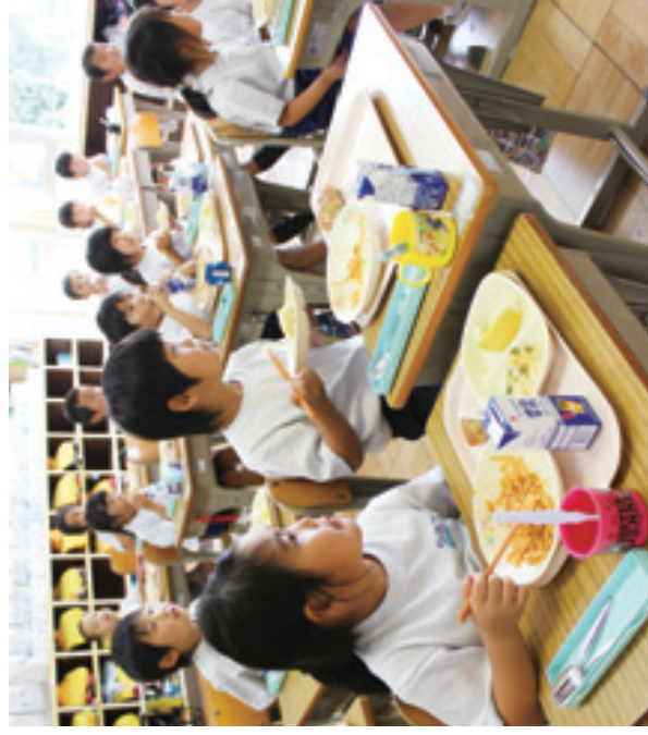
楽しみながら給食の時間