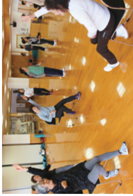
月に1度、エアロビクス教室で体を動かし健康づくり!(保健相談センターにて)

安定的な事業運営と財政の健全化を図りつつ、被保険者の負担軽減を目的に、国民健康保険税率、税額を改定する条例改正が提出されました。