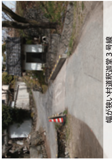
幅が狭い村道釈迦堂3号線