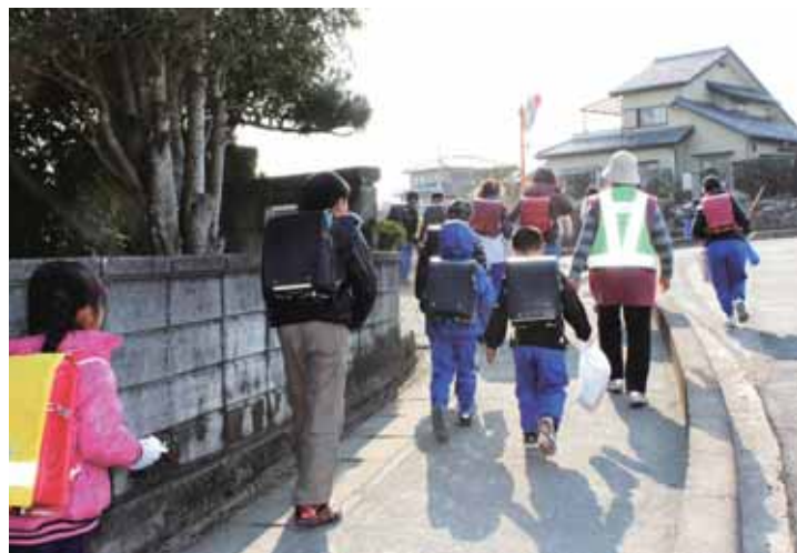
シルバー見守り隊と一緒に下校

答 すか。村長 見守りの連絡体制等も具体的にないため、早急に関係機関と相談してつくりたいと思います。