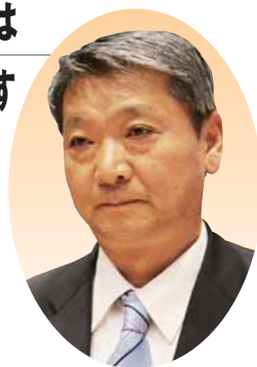
清水 健一 議員