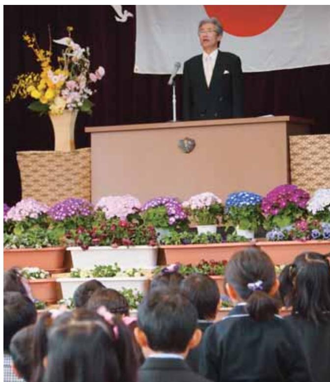
南小学校の新一年生

答 村長 今回、勉強しましたことを肝に銘じて、住民の側に立った、地域に合った対応していきたいと決意を新たにしています。