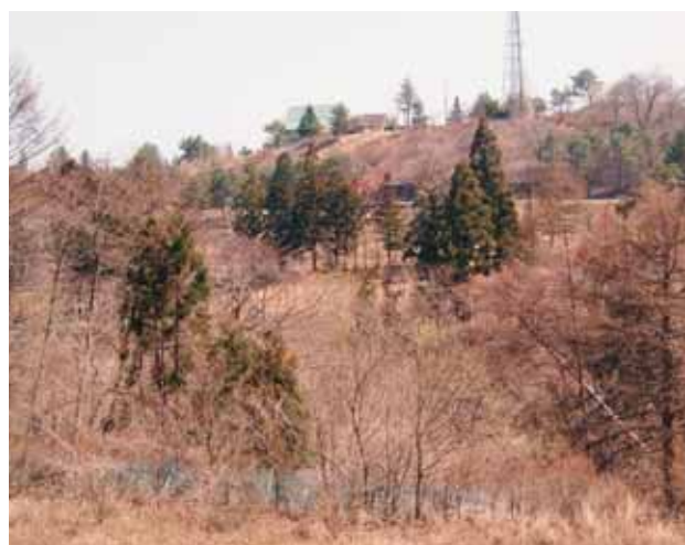
榛名カントリー跡地