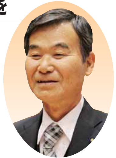
早坂 通 議員