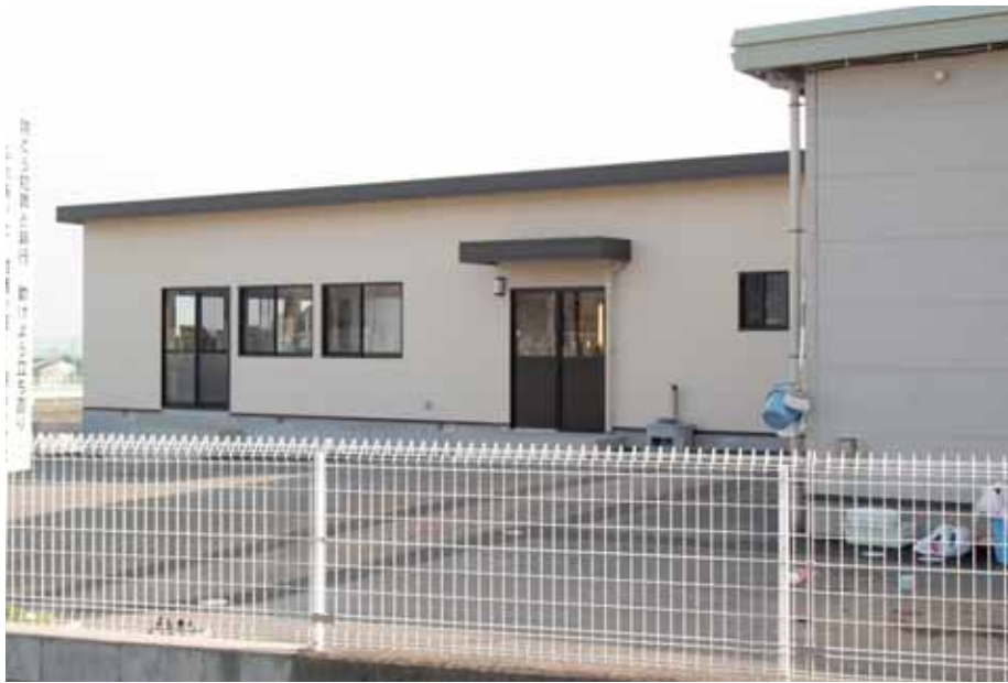
「広馬場一〇八八番地」↓「広馬場一一五六番地」

南部第二学童保育所に隣接するところに南部第一学童保育所が新設されたため、移転に伴う条例改正が行われました。 (全員賛成)