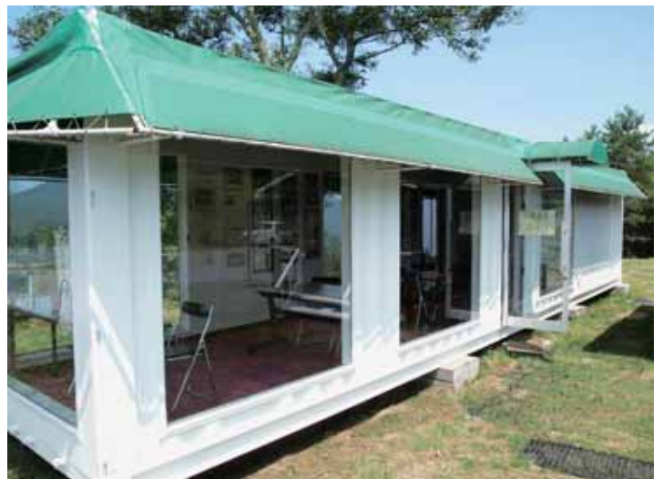
▲八州高原ビジターセンター

質問 建築基準法によるとコンテナを倉庫、店舗または事務所で使用する場合には建築物に該当するとあり