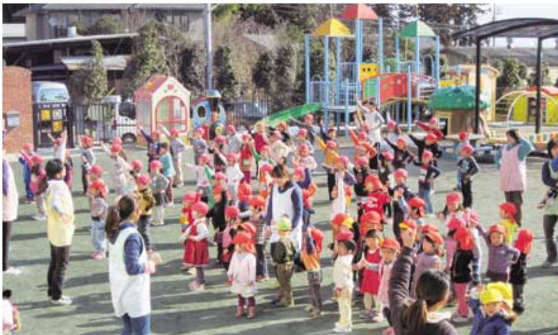
▲みんなで体操たのしいな

平成23年第1回定例会は、2月28日から3月10日までの11日間の会期で開かれました。本定例会では、平成23年度予算をはじめ条例改正、補正予算など議案27件、選挙管理委員及び補充員選挙、委員会提出議案1件が提出され、いずれも原案どおり可決しました。