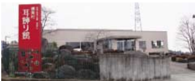
▲看板・外壁が新しくなった耳飾り館

この2月までに700人程度増加をしています。23年度に群馬DCが行われ、産業振興課と連携しPRをして入館者の増加につなげたい。