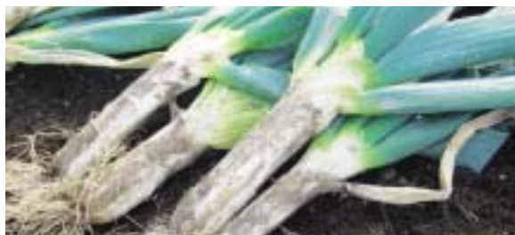
▲榛東でとれた下仁田ねぎ

質問 下仁田ねぎの種代補助をいつまで継続していくのか、なぜ種代だけなのか、作業用機械、販売対策に補助を。