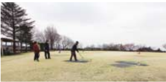
▲グラウンドゴルフ場で楽しむ人たち

産業振興課長 不況等でリストラに遭った方が雇用で苦しんでいる。一時的ななぎ雇用として採用しています。