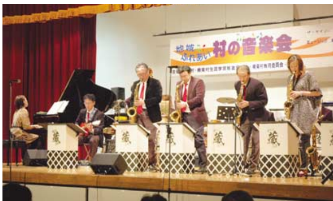
▲バンド名「ミュージック(蔵)クラブ」