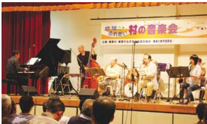
▲バンド名「ザ・ケイノート・8」

教育委員会主催で恒例の「ジャズコンサート」16回目が今年も盛況でホツとしている。第1部では要望も有って戦後の「ジャズ喫茶」を思い出すような「モダンジャズ」を、第2部では、「スイングジャズのビックバンド」を紹介。お客さんの感動と拍手が出演者にも伝わって、ジャズではとの・当初の疑問は解消され、今では、同種のイベントで県内随一と評価され感無量であり、榛東村だけの「ジャズ文化」が南部コミセンで息づいて来たように思えるのは嬉しい。(綿貫)〈10月3日 南部コミセンにて〉