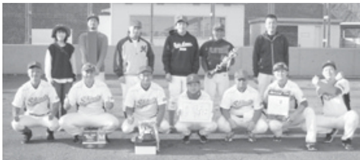
優勝：榛東野球クラブ