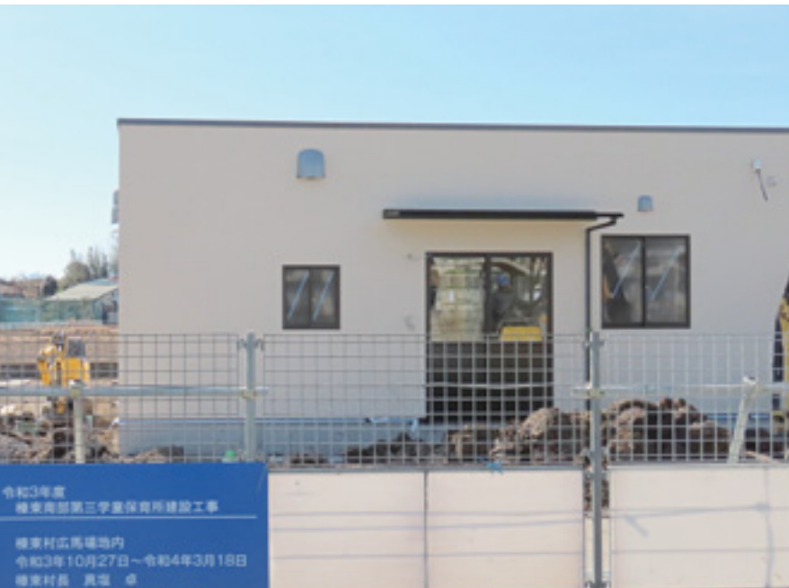
建設中の南部第三学童保育所 令和4年4月1日から使用開始予定