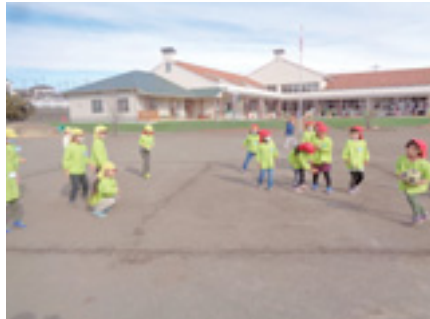
こども園等の様子