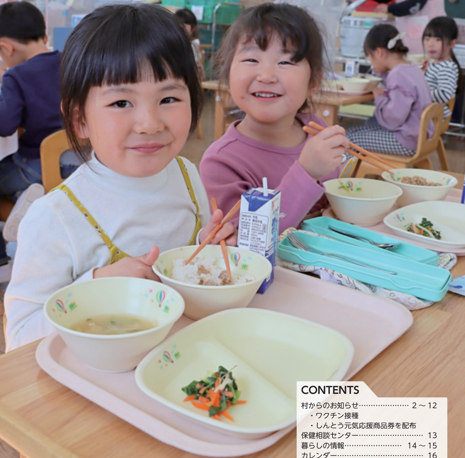
おいしい給食いただきます！（南幼稚園）