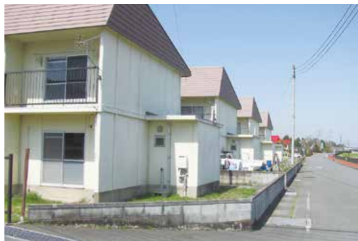
周辺の野良猫対策を

答 産業振興課長 延伸道路の通過交通の状況がどのくらいあるか、費用対効果などを検証したいと考えています。