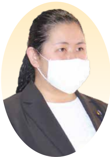
すだひとみ 須田仁美 議員

で放課後の2時間程度20程度の開催を予定していますが、令和2年3年は中止しました。地域人材と心温まる触れ合いを通して楽しく学習でき、大変人気があります。学童の定員問題には関わらないと思います。