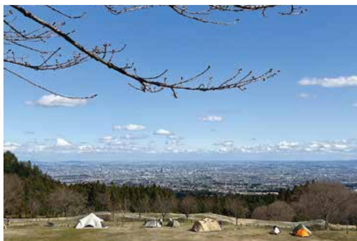
ストライダーコースも含めたリニューアルの検討を

当日朝の納品など難しさがありますが、米は備蓄も考えられますので、研究していきます。