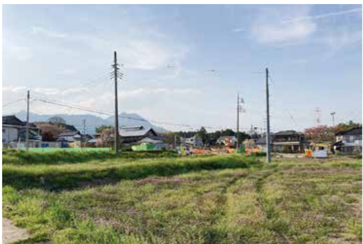
活性化が期待される上毛大橋延伸道路

答 防災中核機能施設の事業内容の充実については、どのよう催しや教室を開催するか詳細な方向性を打ち出す予定です。