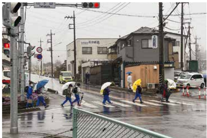
歩者分離を希望する交差点

問 村内各地の危険箇所について県への要望や村で対応できることはありますか。 答 建設課長 県道では渋川土木事務所へ、安心安全のための歩道整備について継続的に要望しています。