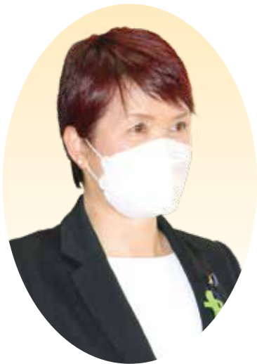
はたのさわこ 波多野佐和子 議員