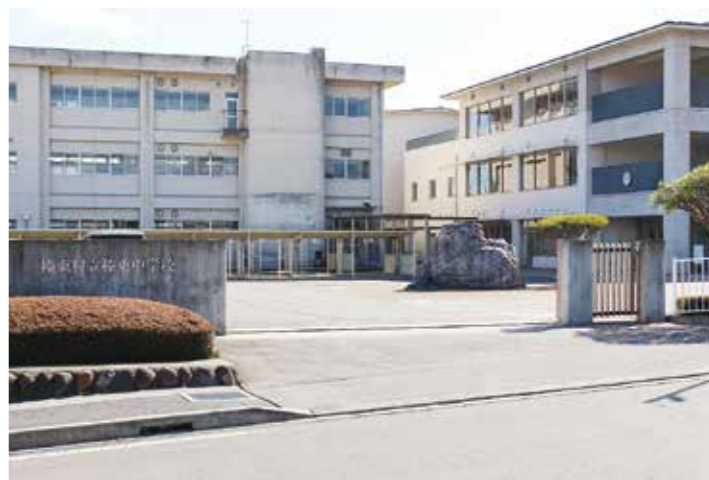
学力調査で全国や県を上回る

答 産業振興課長 村単独での創設は考えていません。農業者の経営努力では避けられないさまざまなリスクによる収入減少を補填するための収入保険制度があります。この収入保険を活用してもらえればと思います。