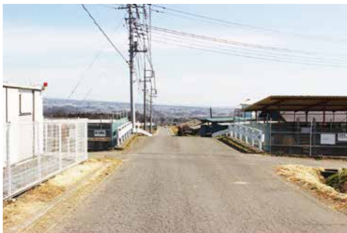
危険箇所の周知を（6号計画道路）

答 建設課長 長岡市内の5号計画道路については、次の工程として用地買収補償を予定しています。また、6号計画道路については、群馬用水の橋梁部の詳細設計、設計済み区間の用地買収及び補償を実施する予定となっています。