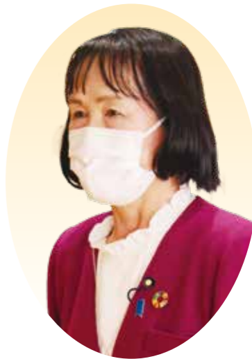
なかじま ゆみこ 中島由美子 議員