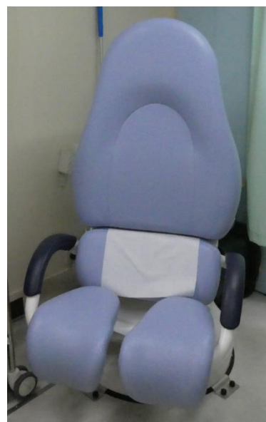
子宮頸がん検診車の内診台