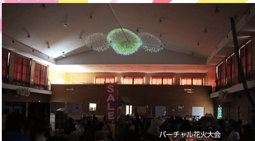
バーチャル花火大会