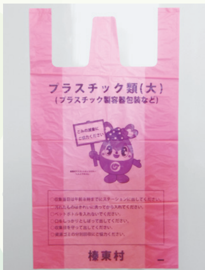
プラスチック類専用指定袋

令和6年4月から始まるプラスチック類の収集に使用する指定袋が、2月下旬から販売開始となりました。桃色半透明の袋にしんとうちゃんのイラストがあらわれたかわいらしいデザインとなっています。可燃ごみおよび不燃ごみ専用指定袋と同様に、お近くの商店にてお買い求めいただけます。プラスチック類の出し方は、「ごみ収集計画表」をご確認ください。