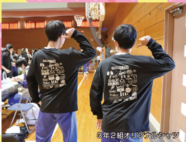
3年2組オリジナルシャツ