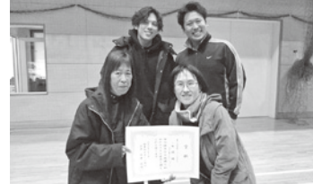
おかあさんといっしょ