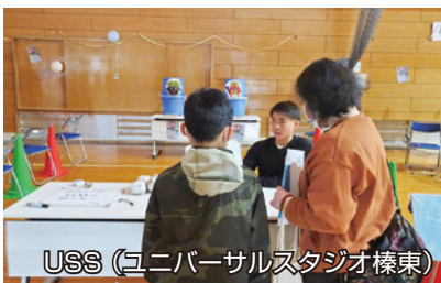
USS (ユニバーサルスタジオ榛東)