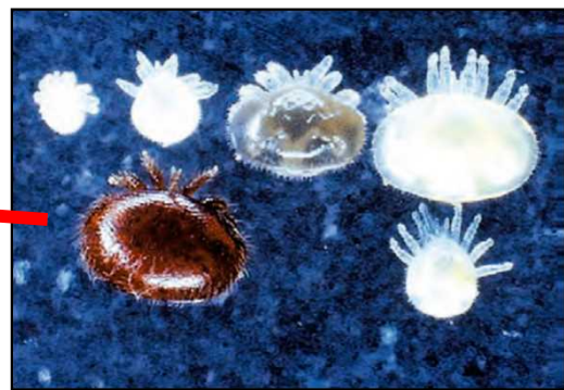
ミツバチヘギイタダニ