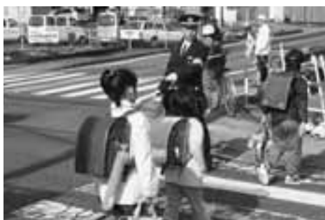
朝の街頭指導してくれる交通指導員さん。よろしくお願いします

街頭指導などの交通安全対策やイベント開催時の交通整理などに活躍してくれる交通指導員を紹介します。