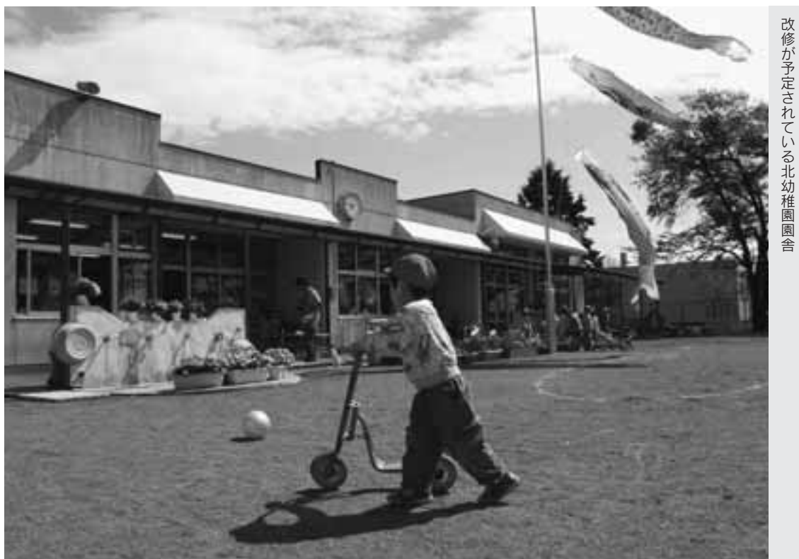
改修が予定されている北幼稚園園舎