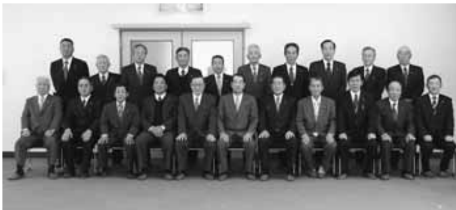
前列左から右へ1～11区、後列左から右へ12～21区の各区長さん。