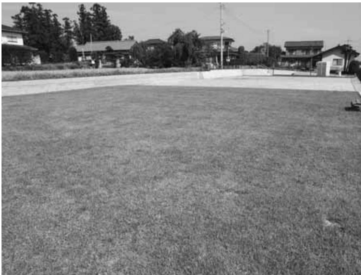
今年度は1区に街区公園が整備される予定です（写真は5区街区公園）