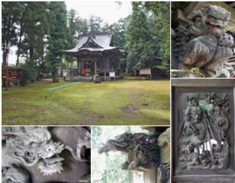
村指定文化財(昭和61年指定)