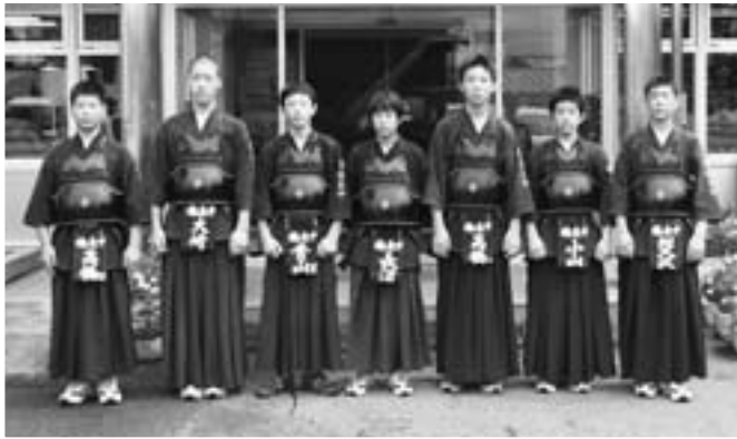
小中学校 剣道部 体操部 吹奏楽部