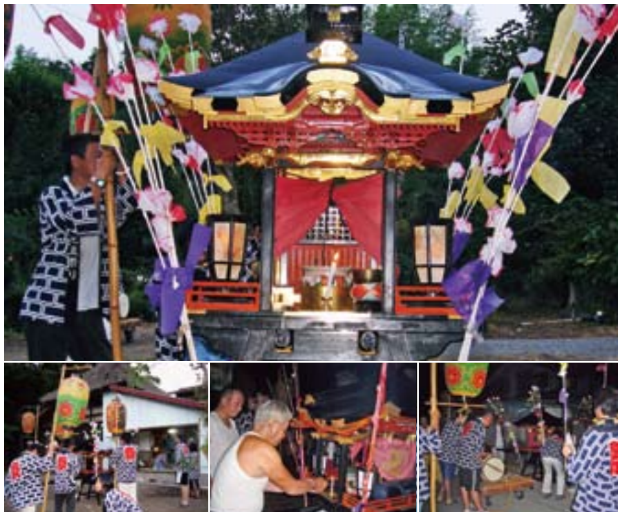
県指定重要無形民族文化財(平成4年指定)