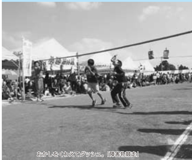
おかしをくわえてダッシュ。『障害物競走』

今年で3回目の開催となるしんとう・村づくり祭。大いに盛り上がった様子をスポ・レク祭部門と産業祭部門に分けてご紹介します。