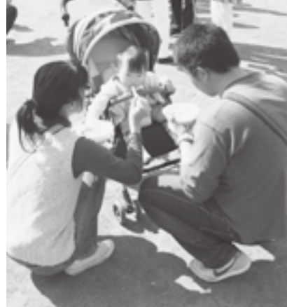
産業祭には多くの親子連れが訪れました

農業や商工業などの村の産業を振興するとともに、村の産業を皆さんに紹介するために実施された産業祭部門。 会場になったスポ・レク祭トラックの隣には、村内で収穫された農産物やワインなどの直売テントが建ち並び、からみもちや自衛隊の協力によるいも煮などのサービスコーナーには長蛇の列ができるほどの盛況ぶりです。多くの方々が村の産物の味を堪能していました。このほかにも、前日に開催された農産物共進会の出品物即売会や村社会福祉協議会によるチャリティーバザーなどが行われました。大勢の方々との村の産業にふれあうことができ、スポ・レク祭と同様に楽しい一日を過ごすことができました。