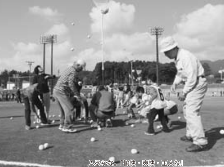
入るかな。『愉快・爽快・玉入れ』