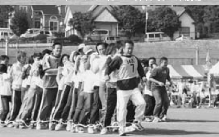
慰労会用の賞品目指して。『一発逆転「榛東賞」レース』