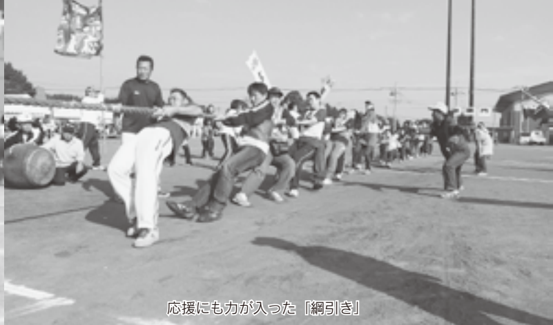
応援にも力が入った「綱引き」