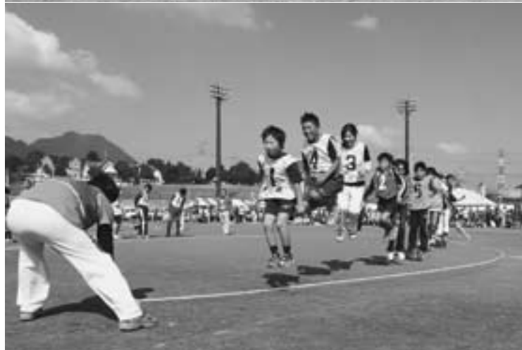
息を合わせて。『みんなでジャンピング』