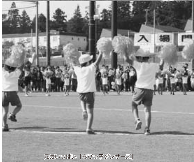
元気いっぱい「ちびっ子ダンサーズ」