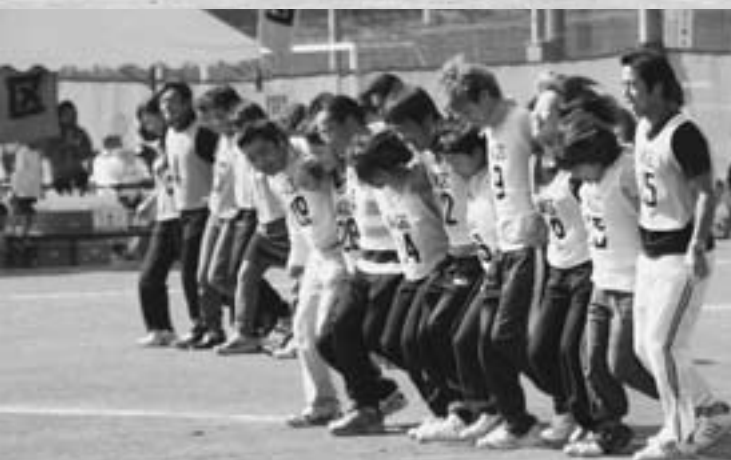
チームワークの見せどころ。『ふそろいの大根足』