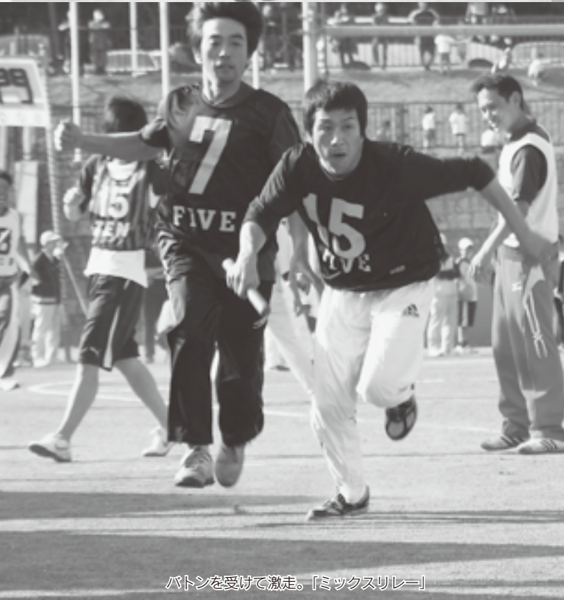
バトンを受けて激走。「ミックスリレー」