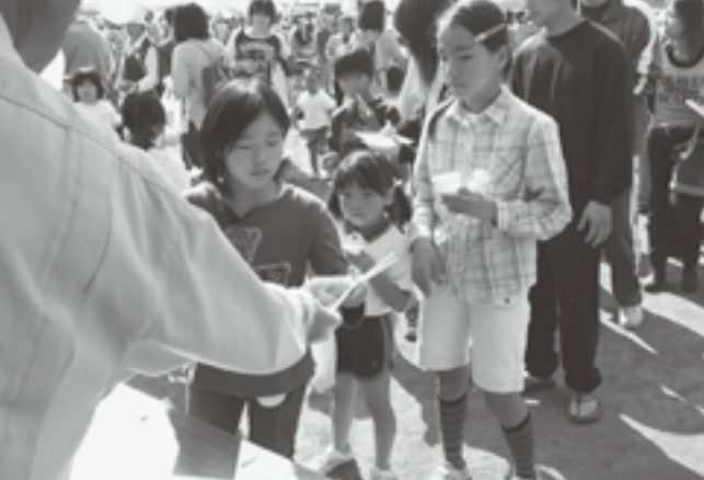
サービスコーナーのいも煮やからみもちが大好評でした