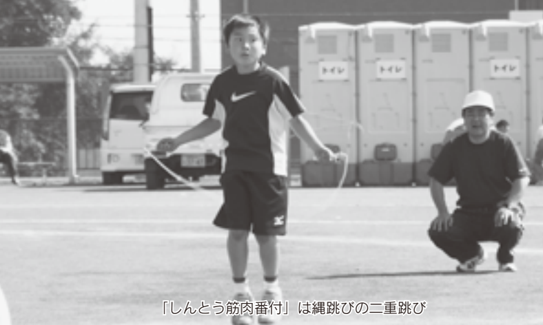
「しんとう筋肉番付」は縄跳びの二重跳び