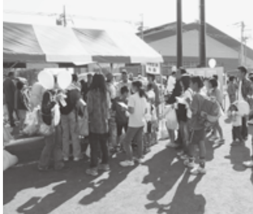
国際交流協会のブースでは、国際交流に関するパネル展示のほか、羊肉がふるまわれました