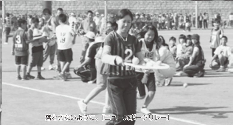
落とさないように。「ニュースポーツリレー」