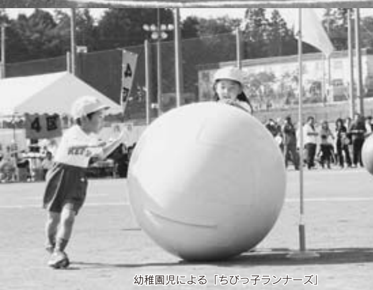
幼稚園児による「ちびっ子ランナーズ」