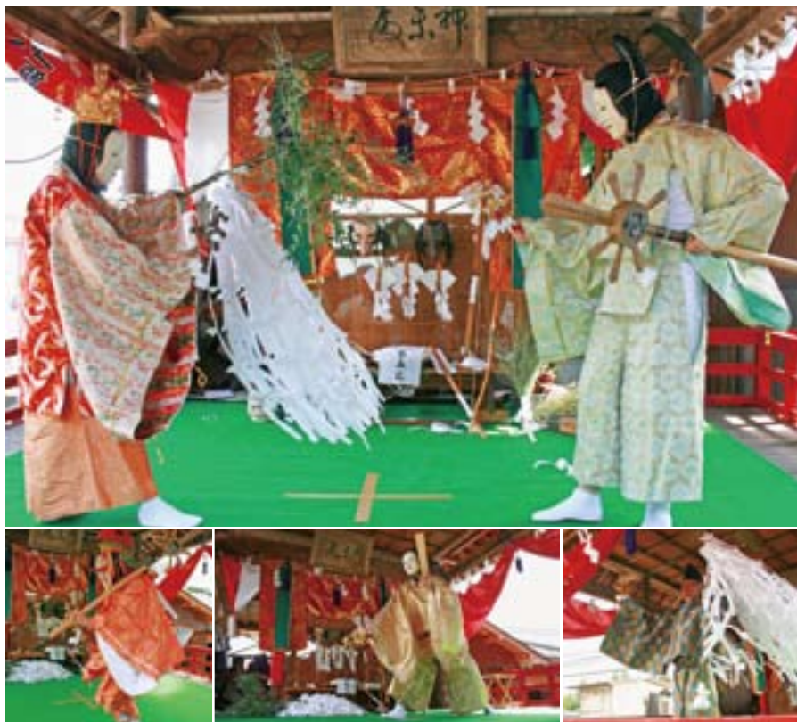
村指定無形文化財(昭和46年指定)