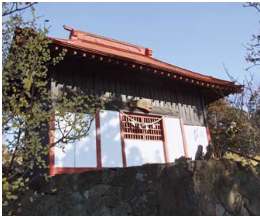
文化財 おおやまずみ 大山祇神社

11区集落の鎮守として奉祀されている。由来不詳であるが、鳥居に「正徳三巳之天五月吉祥日」(1713年)の刻銘があるところから3百年前後の歴史を有していることは確実である。