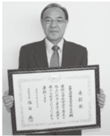
北小学校・南小学校

■ふれあい館休館日 ・1月26日(月) ・2月9日(月) ※毎月第2・第4月曜日が定休日 (休館日が祝日の場合は翌日)