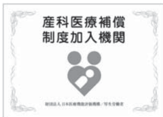
■産科医療補償制度のマーク

平成20年12月1日現在で加入率は97.5%となっています。加入している分娩機関では、「産科医療補償制度」のシンボルマークを院内に掲示していますので、受診の際の参考にしてください。また、加入している分娩機関は、(財)日本医療機能評価機構ウェブサイトの「産科医療補償制度運営事業( http://www.sanka-hp.jcqh.or.jp/index.html )」でも公表されています。