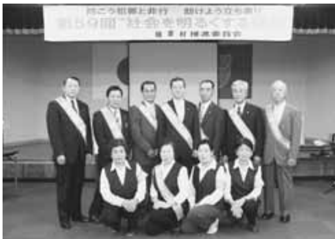
村長と村内への広報活動に出発する保護司および更生保護女性会役員の皆さん