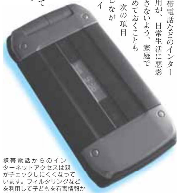
携帯電話からのインターネットアクセスは親がチェックしにくくなっています。フィルタリングなどを利用して子どもを有害情報から守りましょう ※写真はイメージです

また、携帯電話などのインターネットの利用が、日常生活に悪影響をおよぼさないよう、家庭でルールを決めておくことも大事です。次の項目を参考にしながら、親子でインターネット利用の「わが家のルール」を話し合ってみましょう。