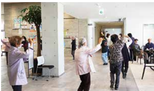
4カ所目の和の場 (しんとぴあカフェ)

介護予防サポーターの登録者は103人、認知症サポーターは43人です。認知症カフェは令和7年度3カ所、令和8年度はしんとぴあを加え4カ所になる予定です。通いの場合は令和7年度、8年度ともに7カ所です。