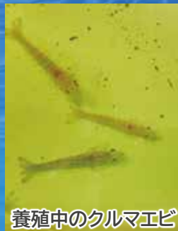
養殖中のクルマエビ