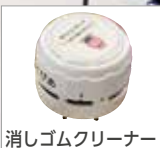
消しゴムクリーナー