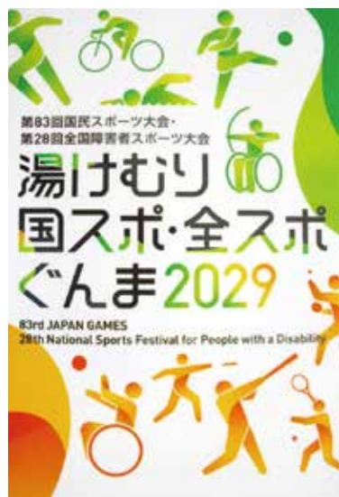
本村はライフル射撃競技