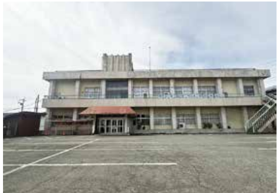
閉館した中央公民館

問 しんとびあや 新学校給食センターのように、複合化・集約化を伴う公共施設整備において、公共施設等適正管理推進事業債の活用や、旧施設の解体、跡地活用、財源確保まで含めて一体的に検討していく考えはありますか。 答 総務企画課長 公共施設の整備は、財政負担の平準化を考慮しながら、旧施設の解体や跡地利用も含めて進 める必要があります。解体には多額の費用がかかるため、必要性を検討し、地価などを活用しながら財源を確保して進めていきます。また、将来世代に過度な負担を残さないことが原則ですが、人口やニーズ、財政状況の変化に対応しながら、計画は適時見直し、慎重に判断していきます。