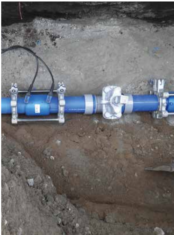
配水用ポリエチレン管 (HDPE)

令和4年度に策定した緊急管路更新計画に基づいて老朽化や需要の状況に応じて優先的に工事を進めていきます。工事が終わるのは今年度末になる見込みです。