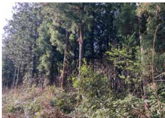
森林整備で広がる恩恵を

村では森林経営管理制度に基づき、森林所有者に意向調査を実施し、森林整備や管理の希望等の把握に努めています。繁茂した竹林等の民有林の整備については、森林環境譲与税を財源として、自治会から要望があった箇所