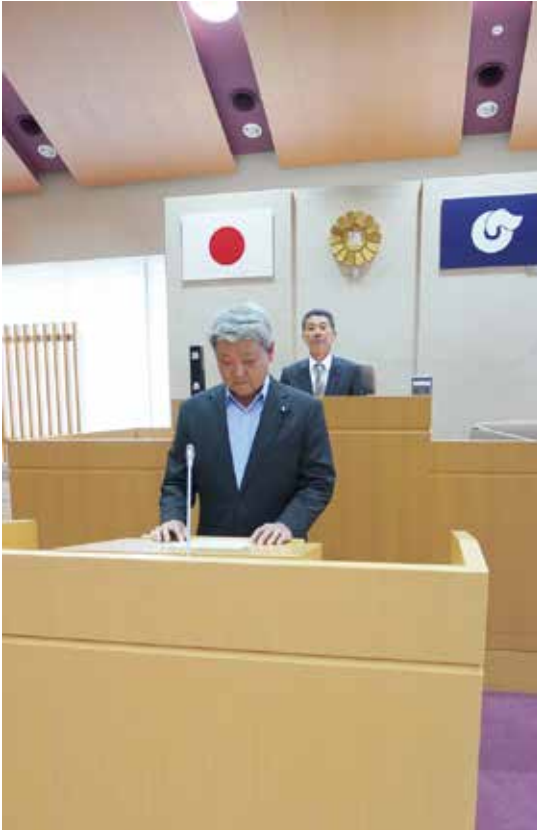
清水委員長による審査報告