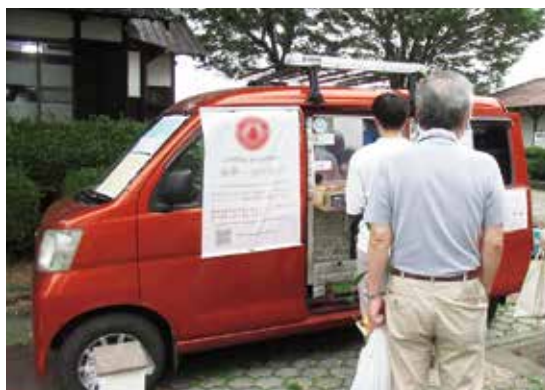
災害時にキッチンカーを

答 総務企画課長 村では、内閣府が作成する避難所ガイドラインと、子ども家庭庁が作成する「災害時の子どもの居場所づくりの手引き」を参考に、子どもの居場所づくりと心のケアについて、他自治体の事例等を踏まえ研究していきます。