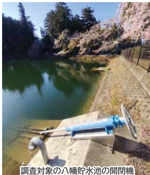
調査対象の八幡貯水池の開閉機

この清算金は、渋川地区広域市町村圏振興整備組合負担金の増加に備え、財政調整基金へ積み立てられます。