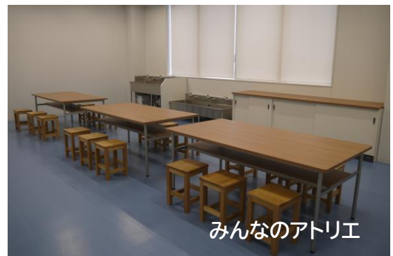
みんなのアトリエ