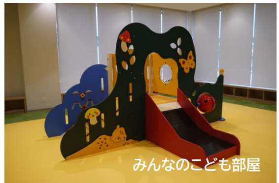
みんなのこども部屋