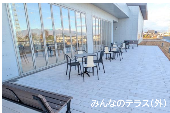
みんなのテラス(外)