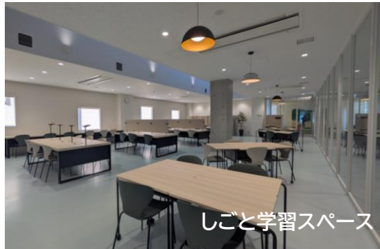
しごと学習スペース

・無断キャンセル(事前連絡無しで利用しなかった場合)は、以後の予約に制限を設ける場合がありますのでご注意ください。